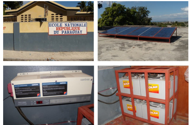
Figure 4. Installation d'électrification solaire-pilote à l'école Nationale de la République du Paraguay

batteries, main d'œuvre et transport) s'est élevé à $6 200.