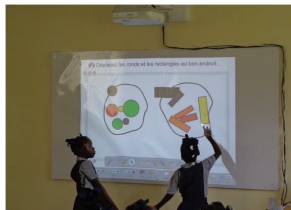
Figure 1. Classe faite avec l'aide du TNI

Le pays a donc choisi de ne pas investir dans l'éducation alors que la pression démographique (3.5% en 2010, parmi les plus élevés de la Région) ne fait qu'accroître davantage la demande de ressources pour le secteur éducatif. Comment s'étonner dès lors que