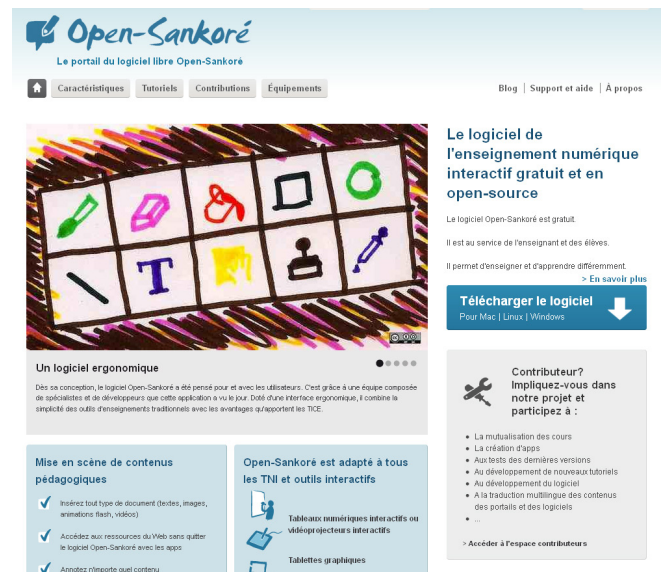
Figure 2. Site internet du programme Sankoré

en cours d'élaboration dans les pays d'Afrique et de l'Océan Indien. La DIENA s'est engagée à soutenir Haïti Futur par des dons de matériel en allant jusqu'à faire entrer Haïti dans les pays bénéficiaires du programme, ce qui n'était pas prévu à l'origine.