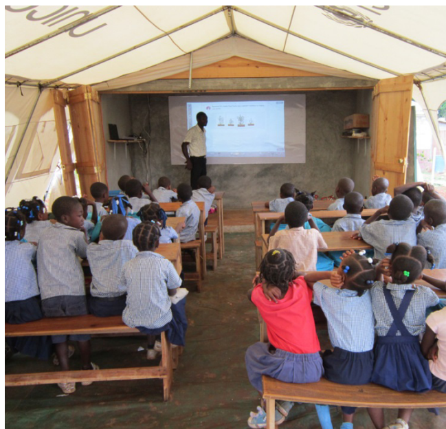
Figure 3. Cours numérique dans une école sous tente après le séisme à La Montagne de Jacmel

L'équipement devait se faire de façon progressive: 12 au moins la première année, 30 à l'issue de la 2 ème année et 60 à l'issue de la 3 ème année. Ceci devait donner le temps de former des installateurs et surtout des techniciens chargés de la maintenance (1 par zone). Le plan d'installation prévoyait de le faire par grappes successives : zone de Port-au-Prince, zone des Cayes, zone de Jacmel, zone de Jérémie.