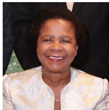
Mamphela Ramphele Ancienne Directrice générale de la Banque mondiale Ancienne vice-recteur de l'Université du Cap