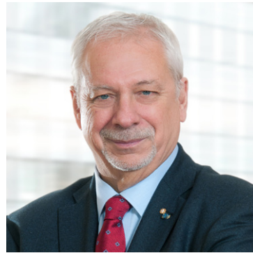
Pierre-Marc Johnson Avocat-conseil au cabinet Lavery Avocats à Montréal Ancien Premier ministre du Québec Président du Comité de prospective de l'Institut Veolia