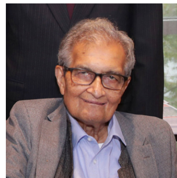
Amartya Sen Économiste, Prix Nobel d'économie 1998, Titulaire de la Chaire Thomas Lamont et professeur d'Economie et de Philosophie à l'Université d'Harvard