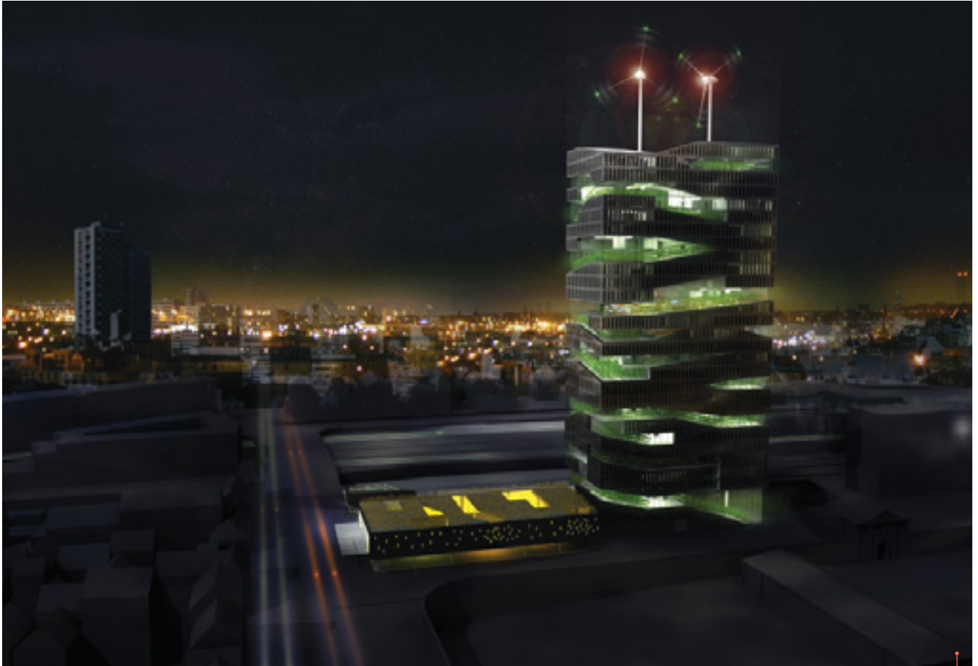
Le concept de la Tour vivante associe une ferme verticale à des espaces résidentiels et des bureaux. ©SOA Architectes

dans lequel les citoyens achètent et consomment des produits provenant de leurs propres bâtiments. Ils pourraient également être équipés de leur propre infrastructure d'économie circulaire, par exemple, avec des systèmes de collecte qui captent et stockent l'eau de pluie, ce qui contribuerait à réduire la consommation et le gaspillage d'eau potable. De plus, les panneaux solaires pourraient être intégrés, surtout dans les régions du monde où l'ensoleillement est abondant tout au long de l'année.